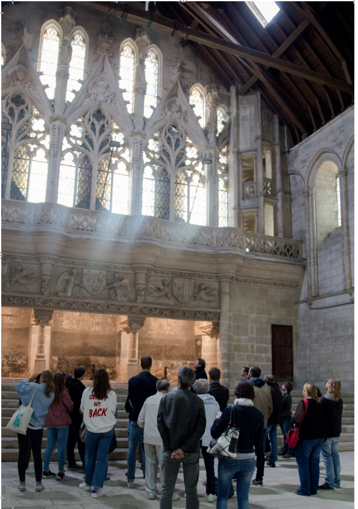
El salón de los Pasos Perdidos - Die „Salle des Pas Perdus“ Wandelhalle