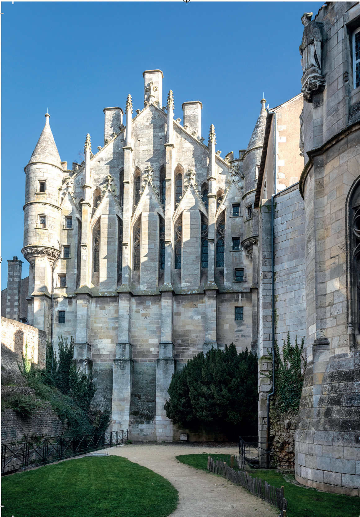
Vista del Palacio desde la Plaza Juana de Arco - Blick auf den Palast vom Square Jeanne d'Arc