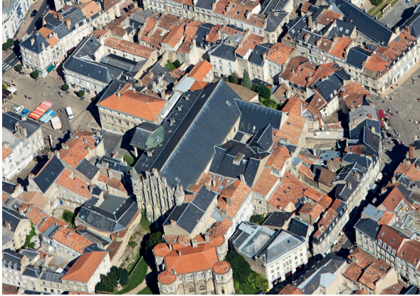
Vista aérea del palacio - Luftaufnahme des Palais

A mediados del siglo XIII, Alfonso de Poitiers , convertido en conde Poitou, llevó a cabo unas obras de gran envergadura en la ciudad. Estableció la separación de funciones entre el «castillo», estructura residencial (mencionado en 1232 y situado en la confluencia de los ríos Clain y Boivre), y el «palacio», donde se instalaba la administración real en pleno apogeo. El gran salón era el lugar privilegiado de los grandes eventos relacionados con la Historia de Francia. En 1307-1308, el papa Clemente V se estableció aquí durante 16 meses para conocer al rey de Francia. Desde Poitiers, gobernaba a la cristiandad y reunía al consistorio*. Las reuniones más importantes se celebraban en el palacio, destacando aquella por la que se decidió erradicar la Orden de los Templarios.