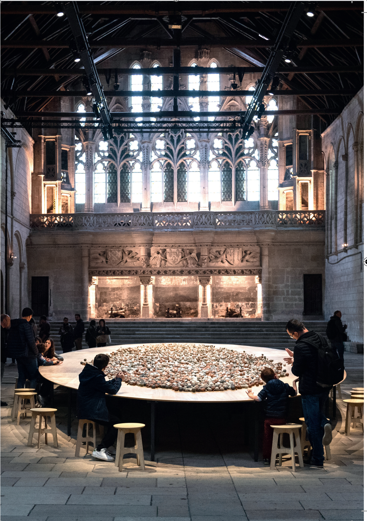
Etalon de los Posos Perdidos durante Trovasesés | Kimsooja en 2019 // Die „Salle des Pos Perdus“ Wondelhalde Trovasesés | Kimsooja im Jahr 2019