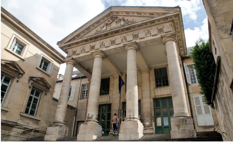
Entrada monumental 1822 - Kolossaler Eingang 1822