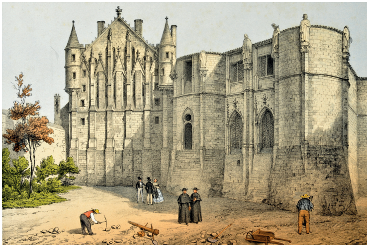
Le square du palais, segunda mitad del siglo XIX, litografía - Le square du palais, 2. Hälfte des 19. Jahrhunderts, Lithographie

A partir de 1436, el destino del Palacio permanecería vinculado a las funciones administrativas y judiciales de la provincia y albergaría la senescalía* de Poitou. En 1453 se celebró en el gran salón el proceso de Jacques Cœur, quien fuera Gran Tesorero del reino de Francia.